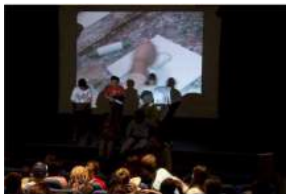
Projection « De l'un à l'autre » au MAMAC juin 2015