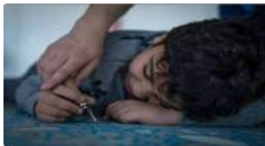
Ateliers réalisés entre novembre 2018 et avril 2019 avec la classe LIS de Mouans- Sartoux

C'est pourquoi l'intégralité de ce projet fera l'objet d'un reportage photo, un livre et de films.