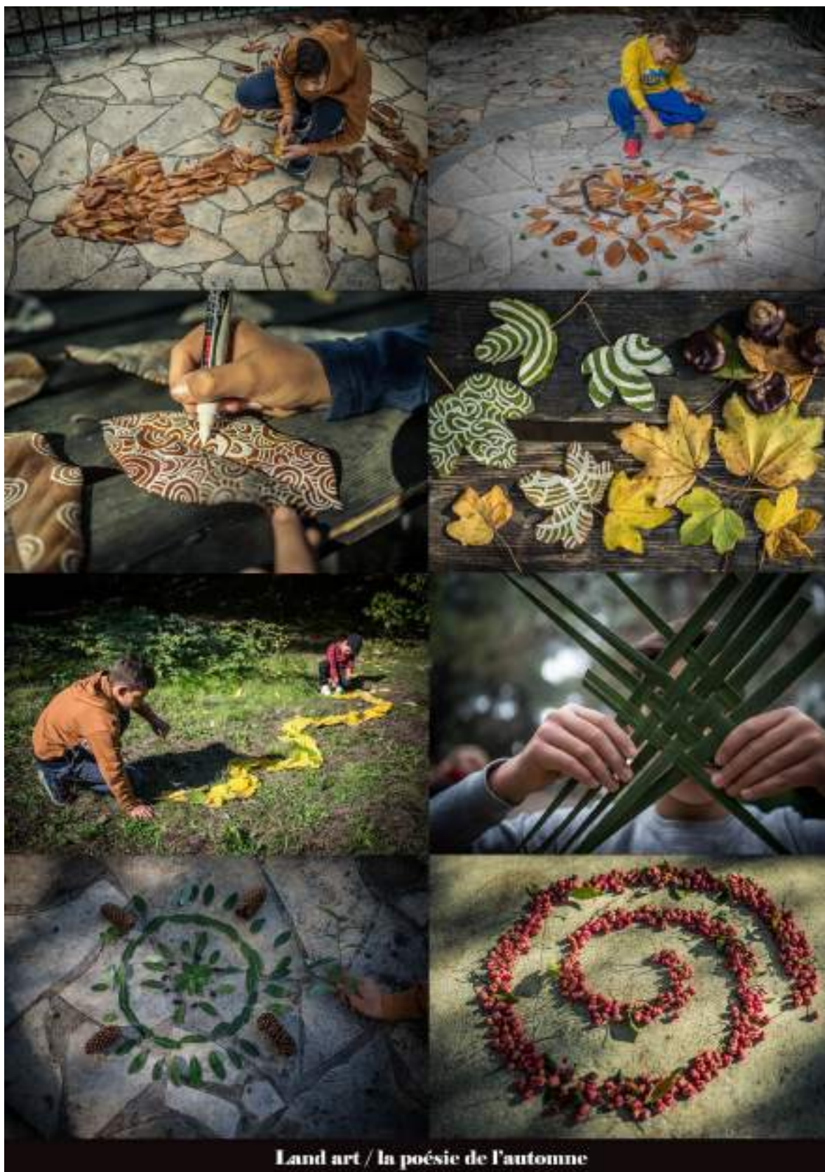
Land art / la poésie de l'automne