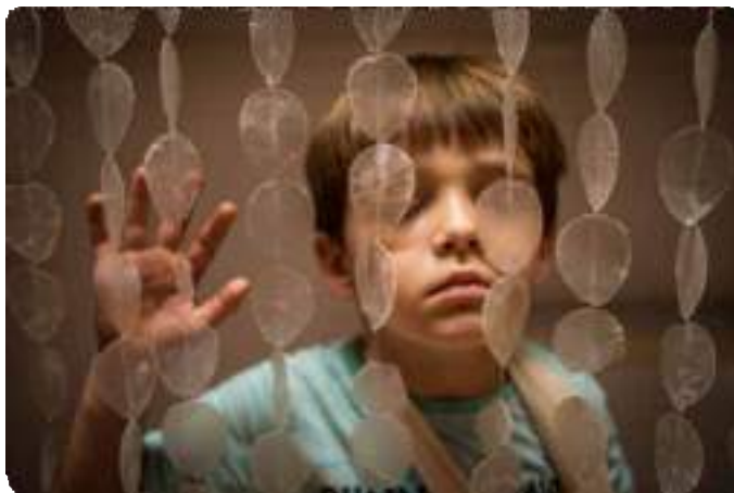
Photos de Sylwia Bernat pour l'APEDV 06 avec les enfants de l'école du Château à Nice

3/ Enfin, la troisième phase conduira les enfants à faire aboutir un projet artistique complet et collectif . Une œuvre urbaine tactile et visuelle qui sera installée de façon permanente sur les murs extérieurs de leur école.